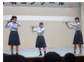
左から：3年5組 [金賞] ・3年4組 [銀賞] ・アトラクション [フルート三重奏]