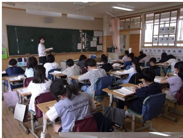
授業の様子(国語) 一組

算数の学習「角の大きさ」で、分度器を使用します。懇談会の時に2組の廊下窓に見本品を展示します。学校を通して購入をご希望の場合は、注文袋の分度器の欄に○を付けてお金を入れ、 5月12日(金)までに 持たせてください。価格は130円です。ご家庭に有るものやお店で購入されたものでも構いません。透明でメモリがはっきりしたものをご購入ください。6月に使用する予定です。注文袋は本日配布しました。