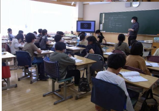
授業の様子(外国語) 三