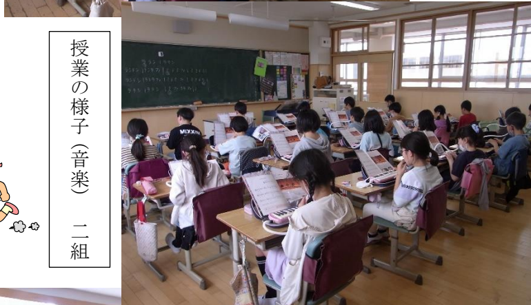
授業の様子(音楽) 二組