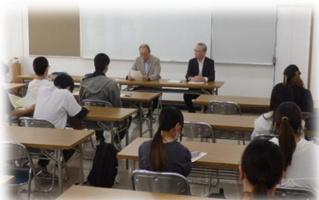
合同企業説明会 事前調査 12時40分～大志講堂

進学希望の生徒も、総合型選抜希望者説明会の参加、東北職業能力開発大学校や高等技術専門学校推薦選考希望者説明会、大学・短大・専門学校推薦型選抜希望者説明会等を経て、推薦願いの提出や願書出願へと進んでいきます。日々の計画的な準備が必要です。