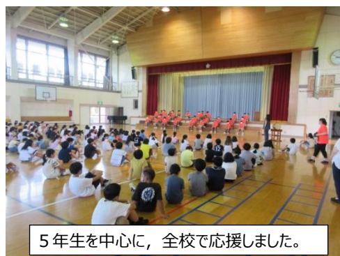
5年生を中心に、全校で応援しました。

また、12日に行われた壮行会では、5年生が応援団のリーダーとなり、全校で6年生にエールを送りました。高学年として、下学年の手本になろうと、大変頼もしい姿が見られました。また、1～5年生全員が声を合わせ、一生懸命に「全力を出して頑張してほしい。」という気持ちを伝えました。選手として頑張った6年生だけでなく、熱いエールを送った1～5年生の子供たちも、大沢小児童全員の頑張りが見られたすてきな行事になりました。