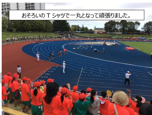
おそろいのTシャツで一丸となって頑張りました。

9月15日(金)、6年生対象の仙台市小学校体育大会・陸上記録会の青葉区大会が実施されました。今年度は、熱中症や天候が心配される所でしたが、当日大きな事故やけがもなく、無事に開催されました。