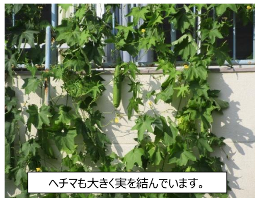
ヘチマも大きく実を結んでいます。

なお、2学期に入ってすぐの10月13日(金)には、開校150周年記念式典をご来賓の皆様をお迎えして盛大に開催する予定です。子供たちの思い出に残るよう記念行事となるよう、実行委員会の皆様とともに準備を進めております。ご家庭でもお子さんとの話題にいただけると幸いです。