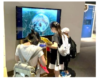
真剣に勉強しています

9月22日に4年生が仙台市天文台に校外学習に行きました。プラネタリウムやひとみ望遠鏡など、楽しく理科を学習しました。