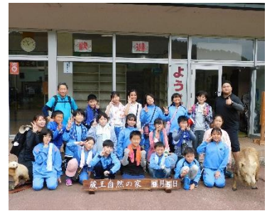
イノシシたちも一緒にパチリ!

9月5日に4, 5年生が蔵王自然の家に野外活動に行きました。壁掛け作りと山の散策, イワナつかみを行いました。自然の豊かさや命の尊さなどを学ぶことができました。