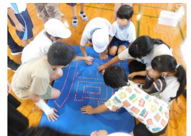
みんなでLEDをまっすぐ刺します