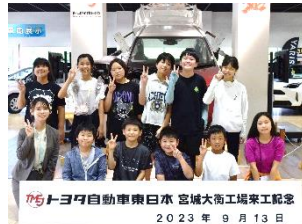
世界最先端の自動車工場

9月13日に5年生が大衡のトヨタ自動車工場見学に行きました。様々な最先端の技術にとっても関心を持って勉強していました。