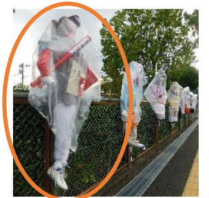
かかし名:生出にきた二刀流

9月16, 17日に市民センターで恒例の「かかしまつり」が行われました。げんキッズのメンバーで放課後に制作しました。結果は、敢闘賞(第3位)をいただきました。