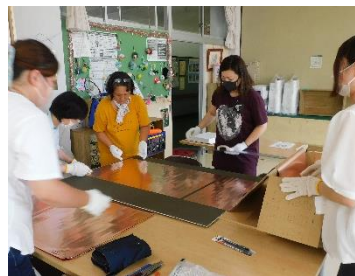
ボードに銅板を貼るのが難しい

9月21日に150周年記念「ピカボード」を縦割りで制作しました。ピカボードは、元尚絅大学教授の阿留多伎真人教授が発明したLEDのイルミネーションボードです。ボードは9月7日に保護者ボランティアで作りました。LEDの差し込みは、全校児童で力を合わせて行いました。近日中に屋上に設置予定です。