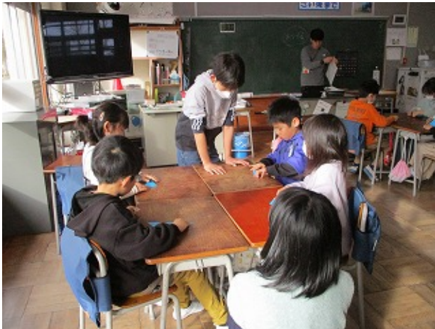
学校行事 | - | -