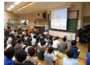
6年生出前授業 「自分づくり夢教室」