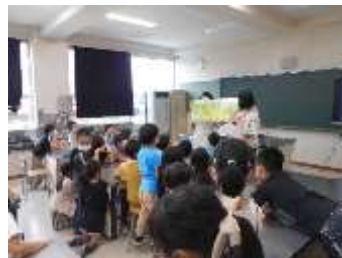
2年生授業 食育 「そらまめ体験」