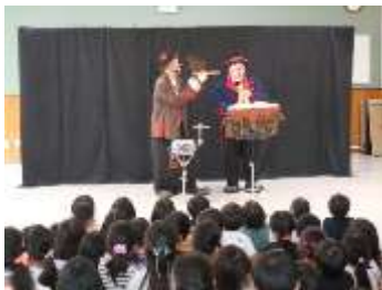
1年生出前授業 芸術鑑賞 「ビリ&ブッチーさん」