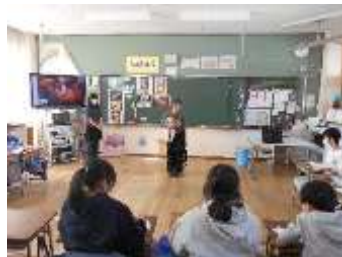
5年生授業 理科 「人のたんじょう」