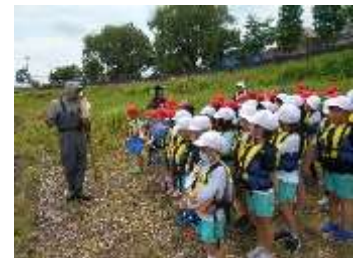
3年生授業 校外学習 「川でまなぼう」