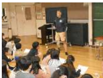
4年生出前授業 「心のバリアフリー事業」