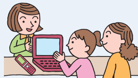
フィルタリングサービスの提供や販売