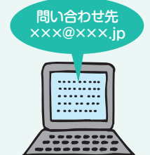
問い合わせ窓口の整備