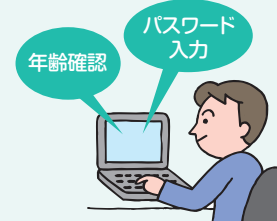
有害情報の閲覧防止の措置