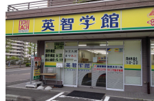
・子供110番 英智学館さん