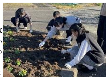
【地域のみなさんのために】

寒さに負けず美しく咲く花で、地域の方々に元気を届けることができればよいと思います。