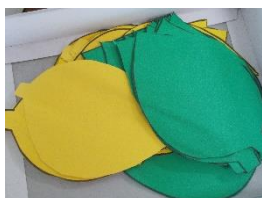
計画委員会企画 「ふわふわ言葉を 全校に広める取組」