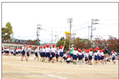
1年：ダンス・アロハ・玉入れ

保護者の皆様方に、運動会を通して大きく成長した子供たちの姿と笑顔をお見せできたことをとてもうれしく思います。来賓の皆様の参加を控えていただいたり、家族の方の人数制限を行ったり、コロナ対策にもご理解、ご協力をいただき、本当にありがとうございました。お礼の気持ちを込めまして、運動会の様子をご紹介します。