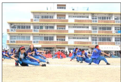
5・6年：蒲っこソーラン2022～情熱～