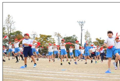
3年：Rising Sun Sun Sun！