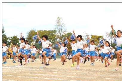
2年：みんなで楽しく！ ジャンポリミッキー！