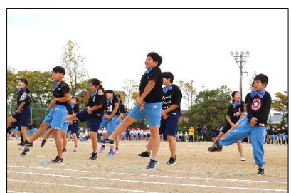
4年：ブラザーフォース！