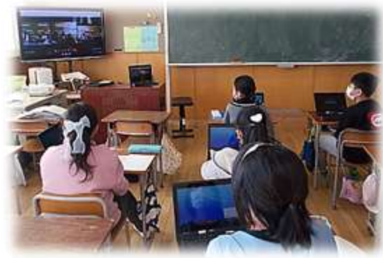
テレビ画面や一人一台端末を使ったリモート会議

議題は、「6年生の卒業に向けて、全校からどんな言葉を送りたいか考えよう。」でした。お世話になった6年生に感謝の気持ちを伝えようと、5年生が中心となり話し合いを進めていきました。