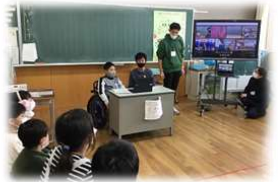
画面越しに相手校の友達を確認しました

8日(水)、特別支援学級では、大和小学校、蒲町中学校の友達と3校交流会をリモートで行いました。事前に準備をした自己紹介映像などを交えながら、お互いに交流を深めました。蒲町中学校には、本校の卒業生もあり、成長した様子をお互いに確かめ合える会ともなりました。実際に会えるようになったときのために今は交流の機会を途絶えさせないようにしていきたいです。