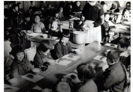
戦後間もない頃の給食風景

日本の学校給食は明治時代、山形県鶴岡市で昼食を持参できない子供たちのために、おにぎりや魚、漬物を用意したのが始まりです。その後、全国に広まりましたが、第二次世界大戦で中断されました。戦後、海外からの救援物資で再開された学校給食は、栄養が不足しがちだった多くの子供たちを救いました。当時の気持ちを忘れず、学校給食の大切さをあらためて考えてみるために設けられたのが「全国学校給食週間」です。学校給食は教育の一環として行われています。子供たちが将来にわたって健康で心豊かな食生活を送ることができるよう、給食を生きた教材とした食育も積極的に進められています。