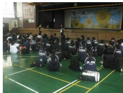
9・12 第1回体育祭実行委員会