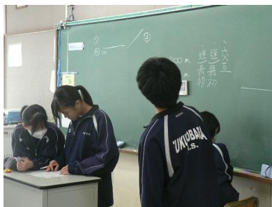
9・26 話し合い活動2年