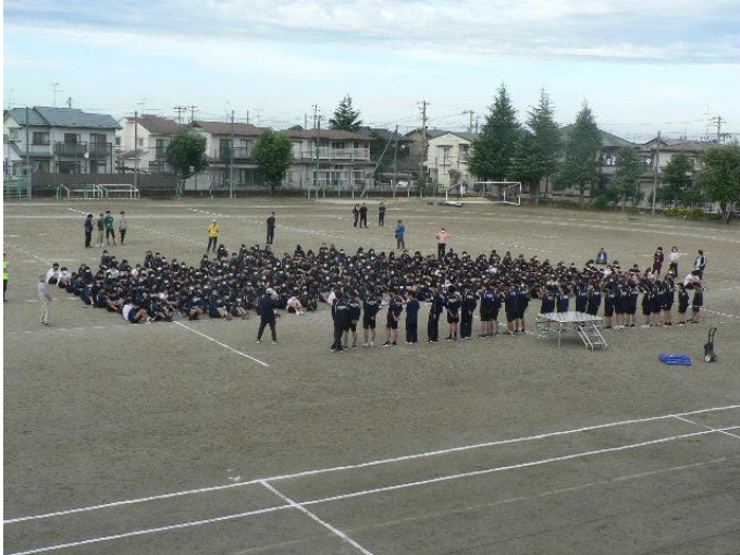
全校で集まり、その後チームごとに話し合いました。