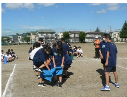
10・3 デカパンリレー1年