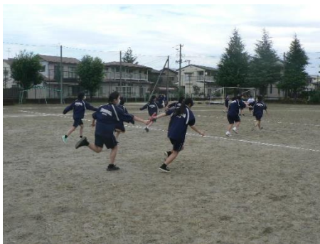
10・4 バトンパス 1年