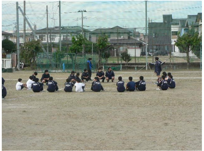
3年生がリードしています！