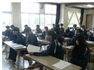
今年は部活動対抗リレーを行います！ その話し合い活動です。