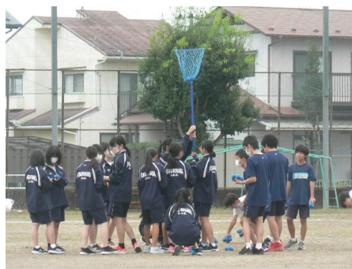
10. 5 玉入れ1年