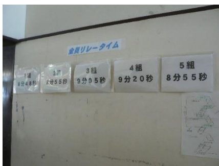
2年生の 全員リレーのタイムが廊下に貼ってありました！