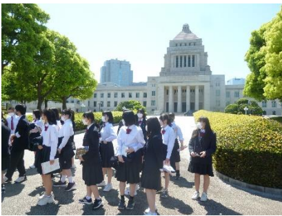
私は3組と一緒に国会議事堂へ