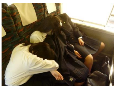
朝早かったので爆睡