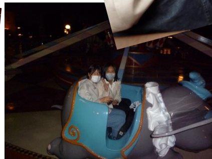
私も一緒に ダンボ