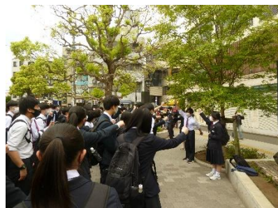
鎌倉到着「せーの！いざ鎌倉」