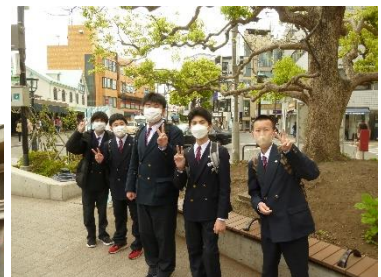
鎌倉自主研修スタート！