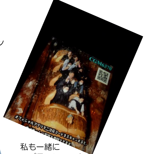
私も一緒に スプラッシュマウンテン