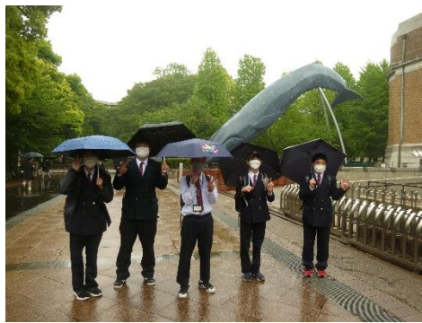
国立科学博物館に到着！