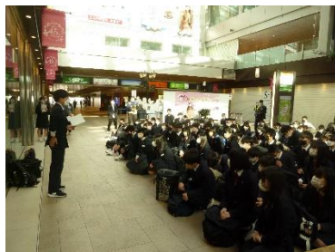
実行委員長の挨拶