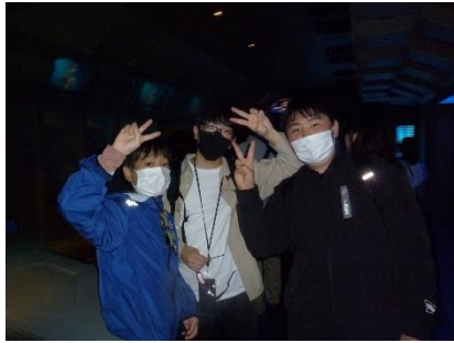
私も一緒にスタートアップズ