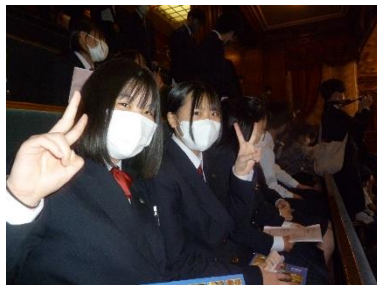
本会議場の傍聴席