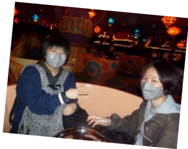
私も一緒にコーヒーカップ