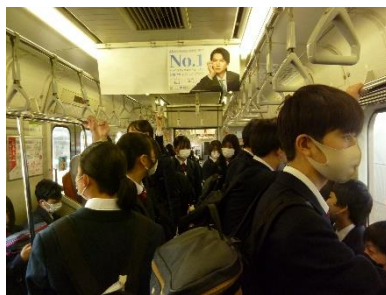
鎌倉へ移動（横須賀線）