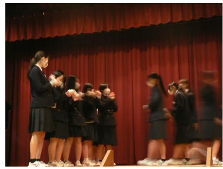
後輩から先輩へ 部活動メッセージ