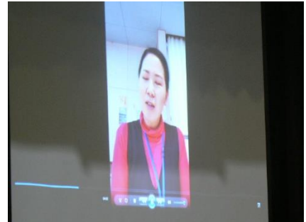
恩師からのメッセージ