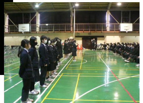
実行委員の頑張り