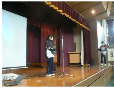
実行委員によるリハーサル