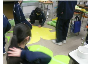
1年生の実行委員が装飾を担当