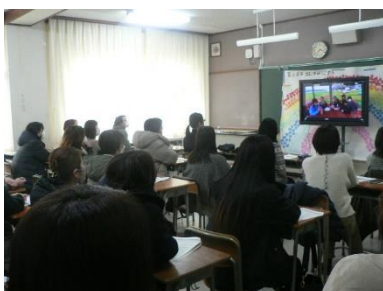
保護者の皆様 ありがとうございます。