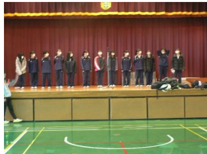
女子バドミントン部