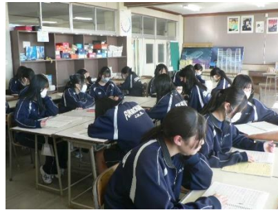
1, 2年生が合同で合唱練習をしています!