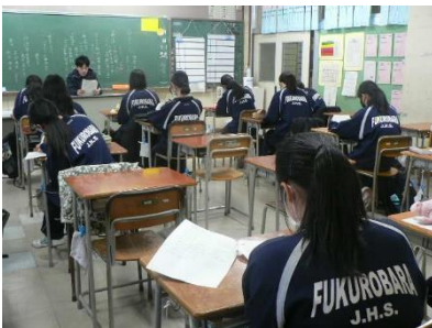
実行委員の話合い