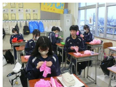
実行委員が花を作っています!