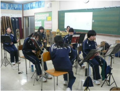
吹奏楽部が当日に向けて練習