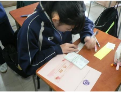
2年生が3年生に招待状を作っています!