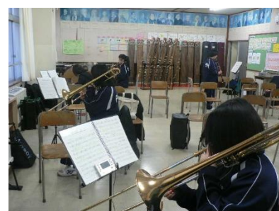
吹奏楽部が盛り上げます!