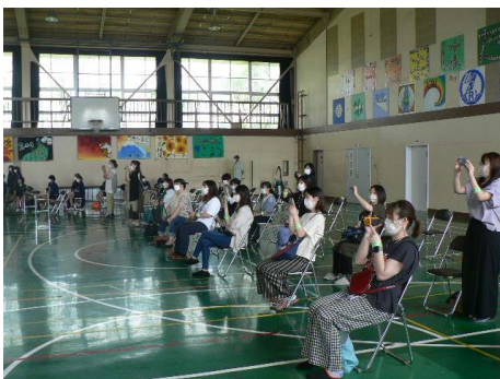
発表生徒の保護者