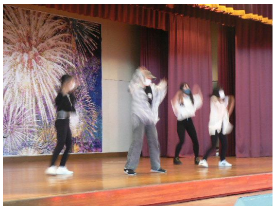
White Black 2年生