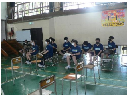
ステージ担当の実行委員