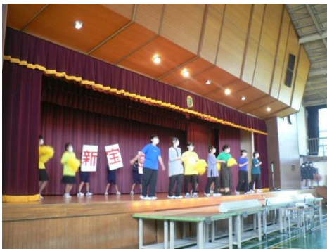
生徒会執行部のオープニング