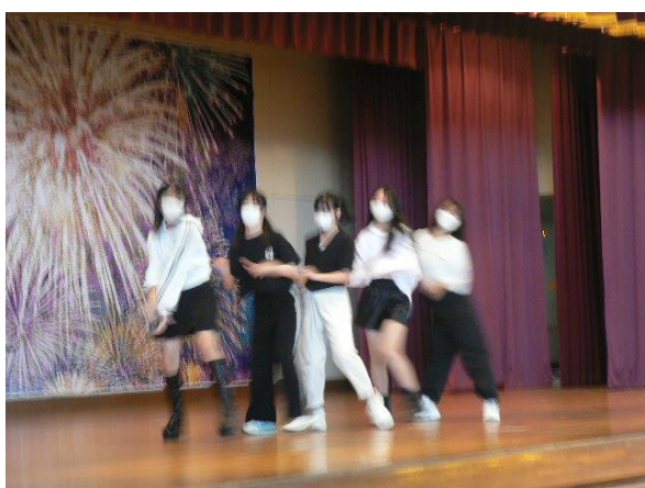
FIVE MIDZY 3年生