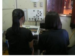
放送担当の 実行委員