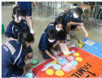
学級旗, もうすぐ完成!