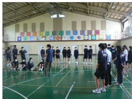
有志団体の打合せ