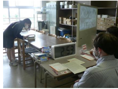
英語弁論 (ALTによる指導)