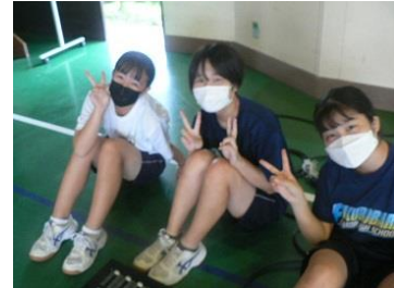
フットライト担当の 実行委員