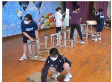
実行委員 (ステージ大道具)の支え