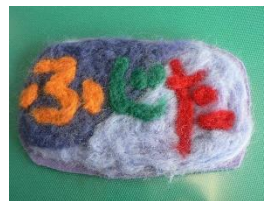
いちい学級の生徒から いただいた ネームプレート