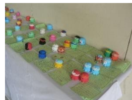
野外活動の タコロン