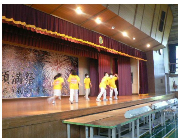
にわか男子と、その熱烈なファン（笑）