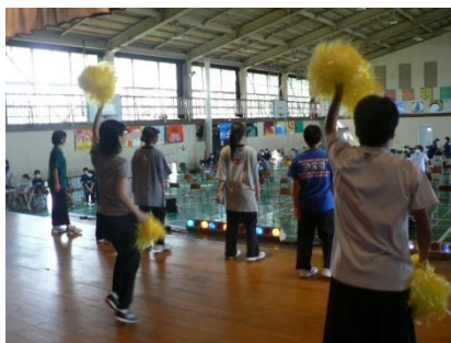
執行部のオープニング