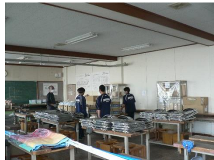
ジュースを運んだりしました！