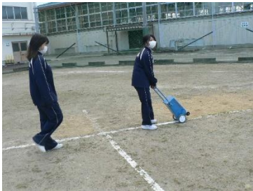
ラインを引いたり