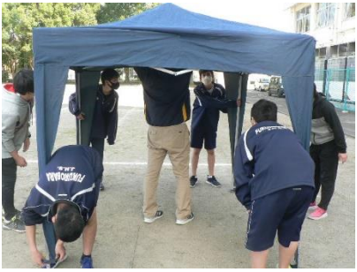
テントを組み立てたり