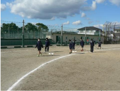
地ならしをしたり