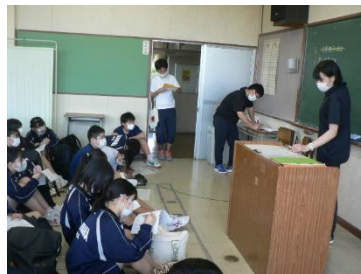
9・12 第1回体育祭実行委員会