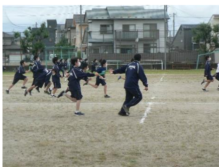
体育の授業 9・22 バトンタッチの練習 1年