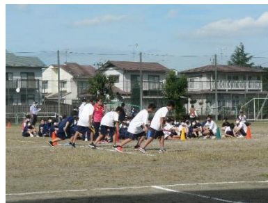
9・26 「位置について、よーいドン！」 1年