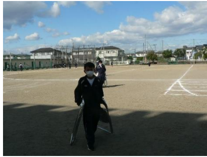
パイプ椅子を運んだり