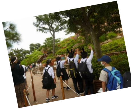
私も一緒に スプラッシュマウンテン