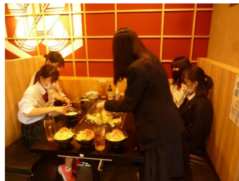
添乗員さんの分も、取り分けてくれました。