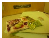
「校長先生どうぞ」とお菓子をたくさんいただきました！