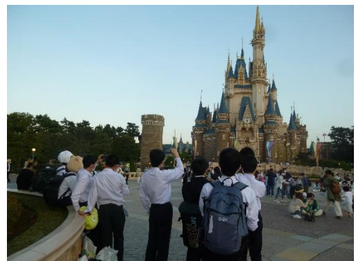
18時頃のシンデレラ城