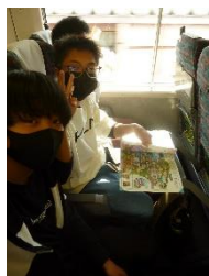
ディズニーの予習