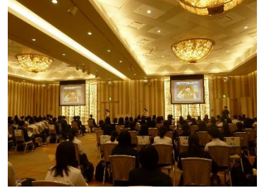
午前中は ディズニースタッフの「おもてなし講座」