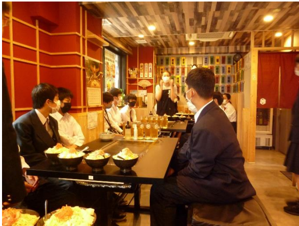
お店の方による、もんじゃ作りの説明

1組・2組・3組は、品川アクアパーク → 月島もんじゃ焼き 4組は湯島天神 → ちゃんこ鍋