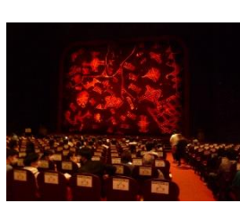
劇団四季 「ハクナマタ」