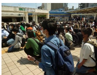
いよいよ自主研修スタート！