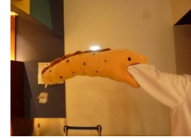
品川アクアパーク水族館

1組・2組・3組は、品川アクアパーク → 月島もんじゃ焼き 4組は湯島天神 → ちゃんこ鍋