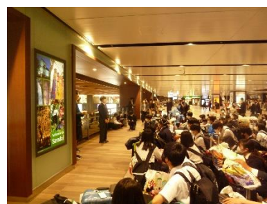
仙台到着！とっても楽しかったですね！！