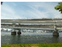
レインボーブリッジ