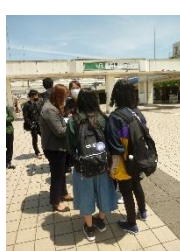
「いってらっしゃーい」