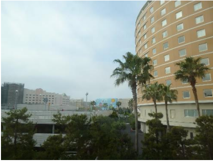
部屋からの朝の風景 3日間、晴天に恵まりました！