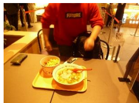
ラーメンとポテト