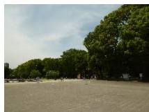
私の自主研修コース 上野公園