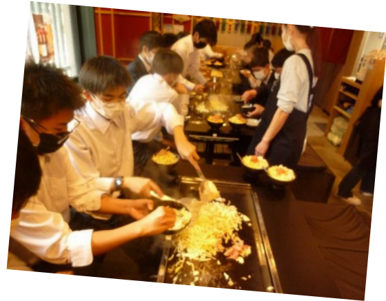
熱々の鉄板に具材を投入し、 土手を作ります。