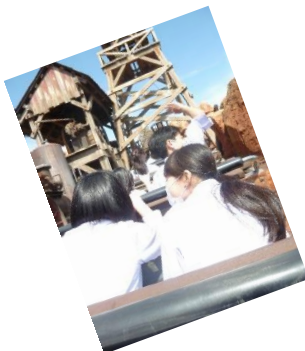
私も一緒に ビックサンダーマウンテン と スペースマウンテン