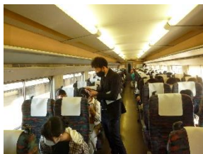
担任とカードゲーム