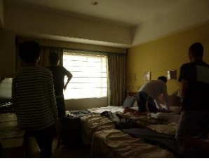
おはよう！ 部屋の様子