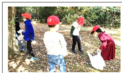
1年校外学習（三神峯公園）