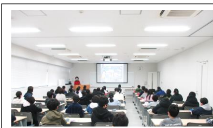
5年校外学習（トヨタ東日本工場）