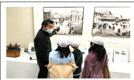
3年校外学習（歴史民俗資料館）