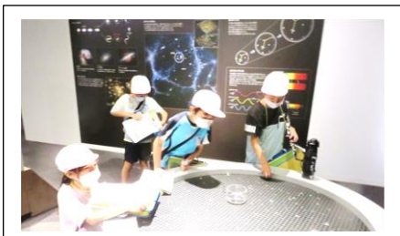
4年校外学習（天文台）