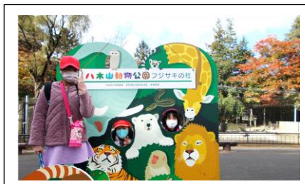
なかよし小中交流会（動物園）