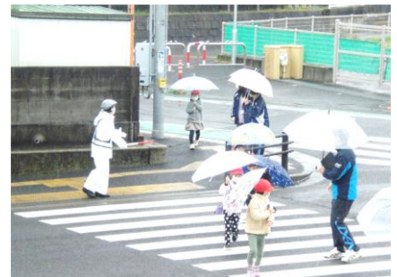
交通安全教室で、道路の歩き方を学習しました。上手に歩いている1年生を見掛けたらぜひ褒めてください。