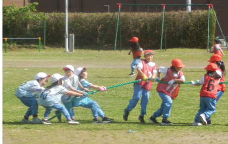
【3・4年 五色綱引きの練習の様子】