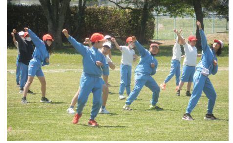
【5・6年 根小ソーランの練習の様子】

※ 練習の様子は、本校HPの「根小ブログ」にも掲載しています。ぜひご覧ください。