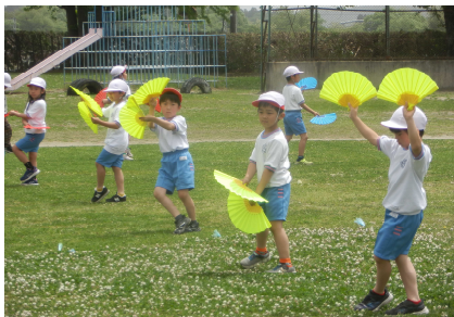
【1・2年生 すずめおどりの練習の様子】

今週末5月27日(土)に予定されている創立150周年記念の運動会に向けて、どの学年の子供たちも一生懸命に練習を頑張っています。仲間と協力したり励まし合ったりしながら練習を重ねる中で気持ちが揃い、自信を持って体を動かす様子が見られます。競技は、例年の各学年の短距離走、低学年のすずめ踊りや玉入れ、中学年の五色綱引き、高学年の根小ソーラン、中・高学年のリレーに加え、創立150周年を地域や保護者の皆様と祝えるようにみんなで踊る内容も計画しています。児童会で決めた今年の運動会のスローガンは「みんなで応援! 全力をつくして楽しもう!」です。一人一人が力を出し切って、楽しい運動会となることを願っています。当日は多くの皆様の応援とご参加で、さらに盛り上がると思います。子供たちの活躍を見に、是非おいでください。