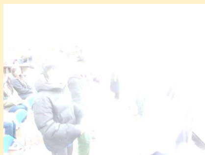
【卒業読み聞かせ】ねっこぼっこの皆様に、全学年児童からのお礼の手紙を、6年生が代表で渡しました。