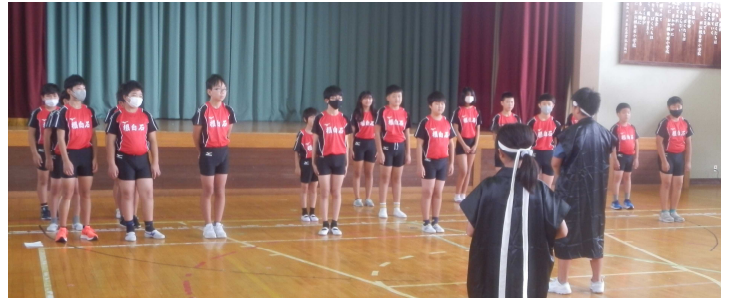
【全校で応援した陸上記録会壮行会】