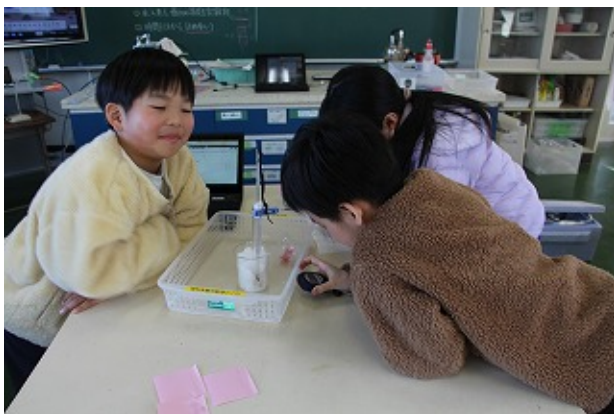
4年 | - | -