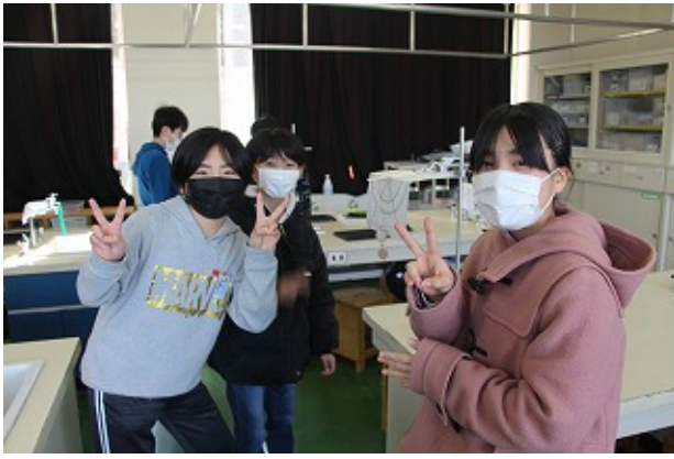
5年 | - | -