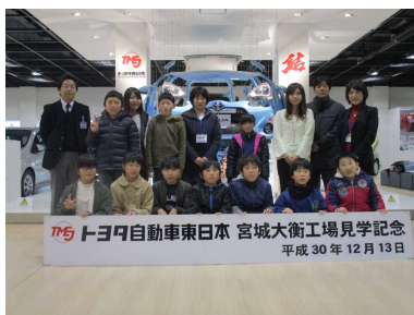
3校交流学习(5年生) 12.13 「トヨタ自動車工場・NHK見学」