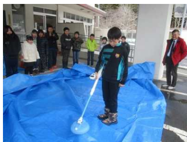
東北大学出前授業 「地雷の捜し方」 12.14