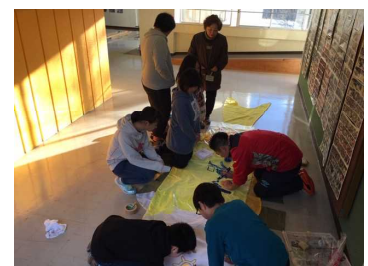
【6年生で下地作り中】

全長5mのこいのぼり。6年生がデザインを考え下地をつくり、みんなで模様を描き入れる計画です。2月の授業参観の時に披露目できればと考えています。お楽しみにしてください。