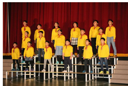
オープニングの全校合唱

今年もあと1か月あまりとなりました。2学期前半のまとめに取り組んでいきますが、学習発 表会で培った努力、協力、全力、そして挑戦する気持ちを大切に、自分のめあてに向かって頑張 るよう励ましていきたいと思ひます。