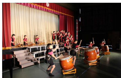
今年度最後の定義太鼓