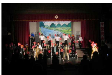
保護者と職員によるPTAの広場