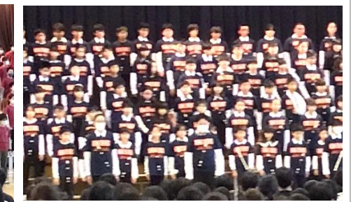
6年 「ひびけハーモニー 届けよう心に」