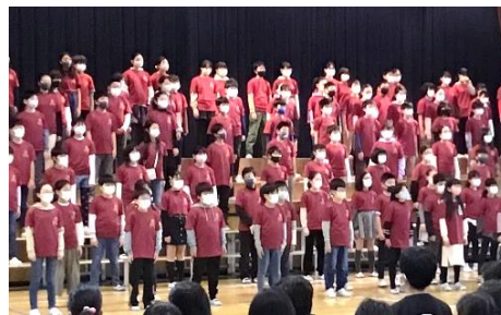
5年 「Same Picture(セიმ・ピクチャー)」