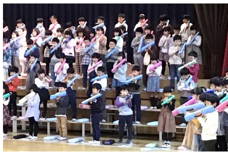
2年 「とどけ! ぼくらのメッセージ」