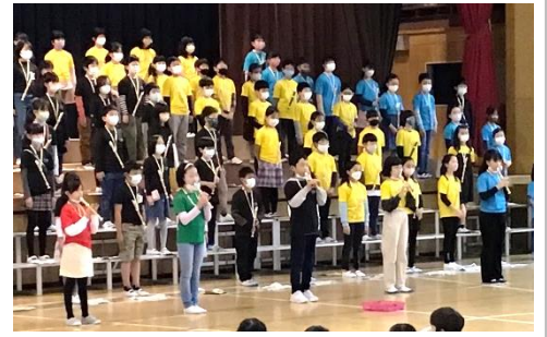
3年 「Across The Road ～Joyful Joyfull～」