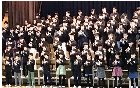
4年 「今 未来のとびらを開けるとき」