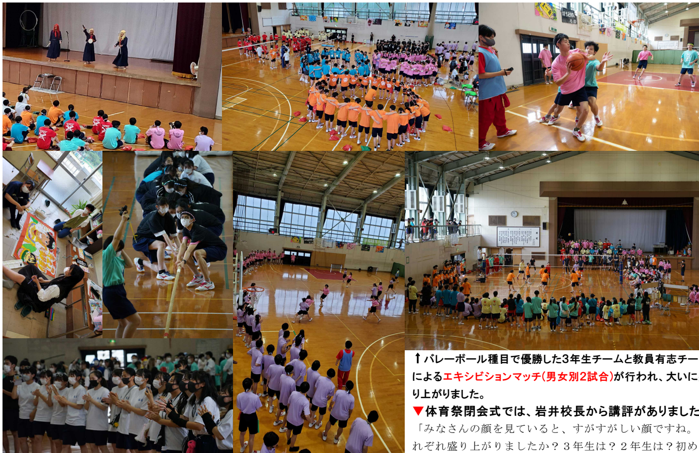
↑バレーボール種目で優勝した3年生チームと教員有志チームによる エキシビジョンマッチ(男女別2試合) が行われ、大いに盛り上がりました。

体育祭実行委員の生徒らが中心となり企画・運営される体育祭。今年のテーマに「仙高廻戦∞麗～青春に満ちれば後悔はないよ～」が選ばれました。「クラス旗」の制作では、趣向を凝らしてクラスアイデンティティを表現しました。3年生だけが制作できる「クラスTシャツ」は、それぞれ磨いてきたセンスが光る素敵なTシャツが出来上がりました。ステージ上ではファッションショーが行われ、全校生徒による投票の結果、3年7組Tシャツが優秀賞に選ばれました。様々な制約の中で生徒達は精一杯工夫をして楽しんでいました。↓コスプレした生徒がステージを進行、皆を盛り上げていました。