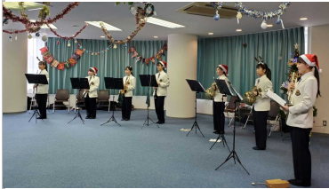
写真は吹奏楽部3年生

12月21日、国見6丁目パーク町内会のイベントに、吹奏楽部が出演し、地域の皆さまと楽しい交流の時間を過ごしました。この地域交流イベントは20年前から行われてきました。