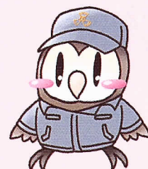
定時制イメージキャラクター つくろうくん