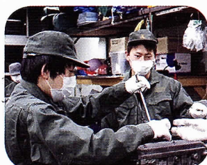
【エンジン分解組立実習風景】