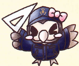
建築 つくろうちゃん