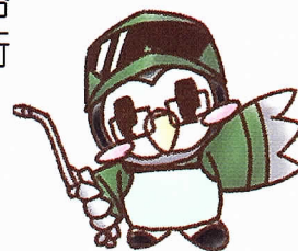
機械 つくろうさん