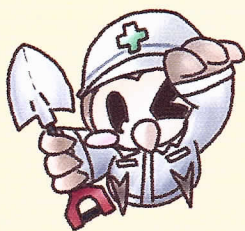
土木 つくろうくん