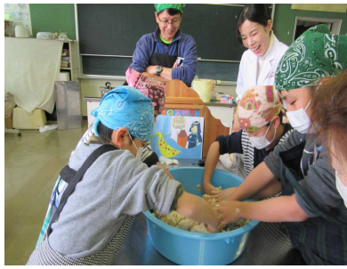
1/17 総合学習「みそづくり」: 中学年