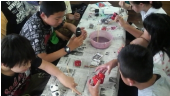
自主研修 あかべこの絵付け体験

6月14日(水), 会津若松市内での自主研修を終え, 予定通りホテルでの入館式を終えました。全員元気です。