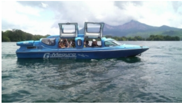
桧原湖でのモーターボート乗船