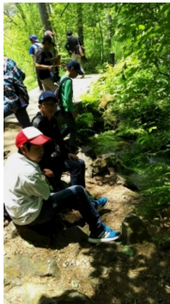
五色沼周辺での自然散策