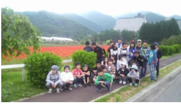
朝の散策「ホテルを背景に はい チーズ！」