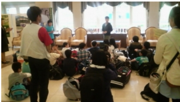
ホテルでの入館式