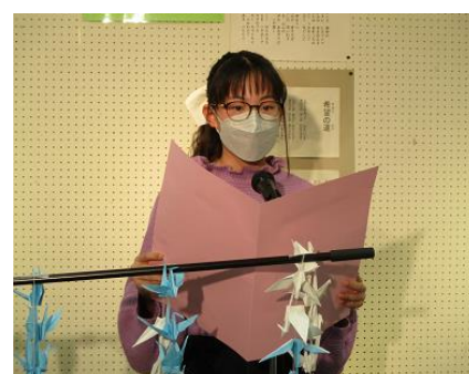
故郷復興プロジェクト