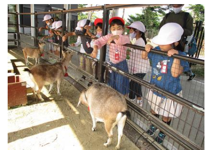
1年遠足（八木山動物公園）

これまで地域よりご寄付いただいた雑巾で校舎の清掃や消毒を行っていましたが、在庫が少なくなってきたため、お子さん1人あたり1枚の雑巾を始業式の日を持たせてくださるようお願いいたします。