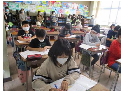
5年算数科授業（5の1教室）

10月13日（火）からすぐに2学期が始まります。引き続きよろしくお願いいたします。