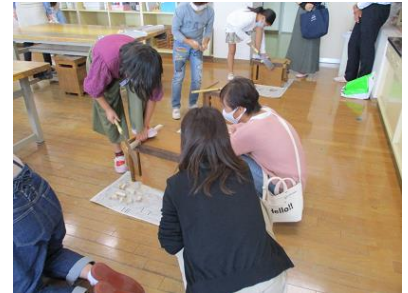
3年図画工作科授業（図工室）