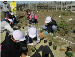
5・6年ハマヒルガオ植栽活動