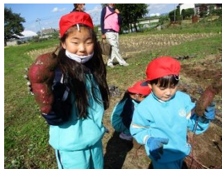
1年サツマイモ掘り