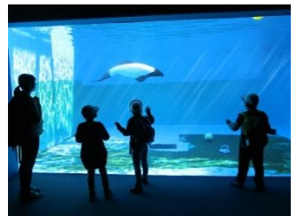
2年うみの杜水族館見学