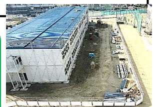
仮設校舎（西側）※屋上から