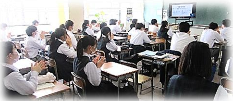
承認の拍手を送る生徒たち