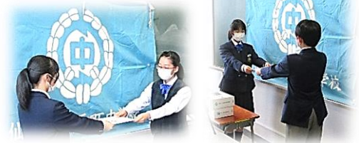
生徒会長から委嘱状を受け取る各委員長(4月)