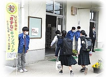
生徒会による朝の挨拶運動(5月)

令和4年度も生徒会、専門委員会、部活動等の活動を充実したものとし、長町中学校の伝統を引き継ぎ、更に発展させてほしいと思います。