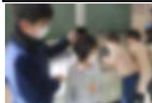
5・6年の保健委員が「保健まつり」の企画・運営を行いました！