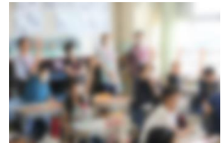
授業参観・懇談会(9/22)の様子

2学期も、協働型学校目標「相手に伝わる気持ちの良い挨拶ができる児童」を目指し、教職員一丸となって、努力して参ります。