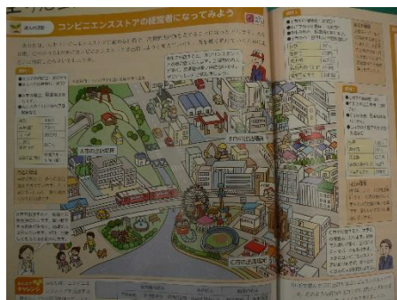
単元の導入（コンビニ出店）

※単元の導入で「コンビニエンスストアの経営者になってみよう」を、単元のまとめで「コンビニエンスストアのお弁当を企画しよう」にチャレンジする。つまり、経済的分野の単元全体を通して、生徒にとって身近なコンビニエンスストアを扱っていく。