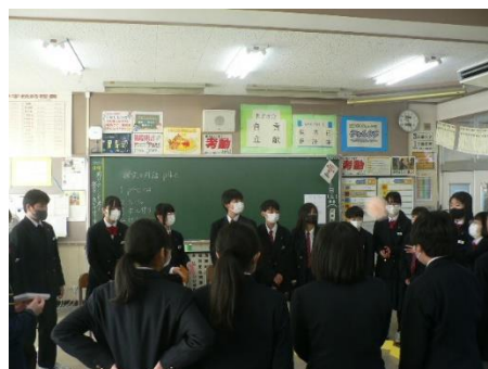
ボールの受け渡し練習