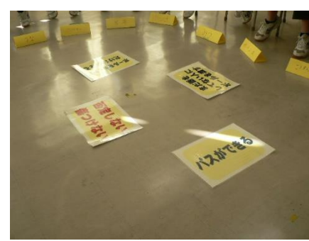
心理的安全性の確保