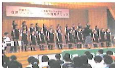
「希望の道」を披露していただいた金剛沢小学校のみなさん