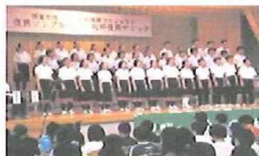
「仲間とともに」を披露していただいた第一中学校のみなさん