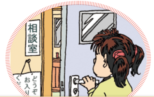
スクールカウンセラーさんやおいしゃさんに、そうだんしてみよう