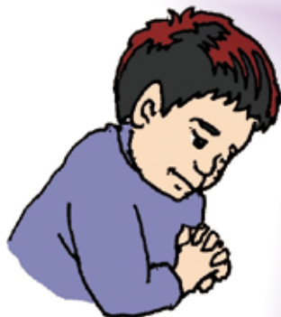
おも だ 思い出してつらい