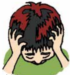
あたま 頭 やおなかが いたくなる