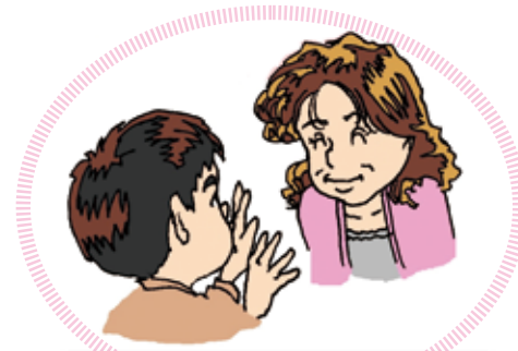
うち ひと はなし お家の人に話をしてみよう