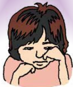
かなしくて なに 何もしたくない