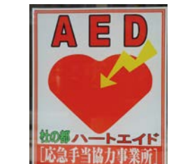
AEDが置いてあるしるし (AEDは心ぞうの正しい動きをとれどすきかい)