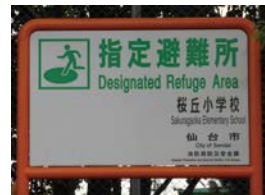
ひなんじょのかんばん

交番、しょうぼうしょ、AED、こうしゅう電話、高いたてもの、こうしゅうトイレ など