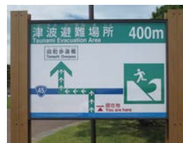
つなみひなん場所のかんばん