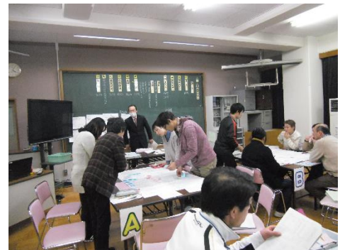
授業検討会 ワークショップの様子