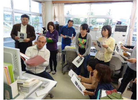
ドキュメントスキャナの 使い方（自由参加研修）