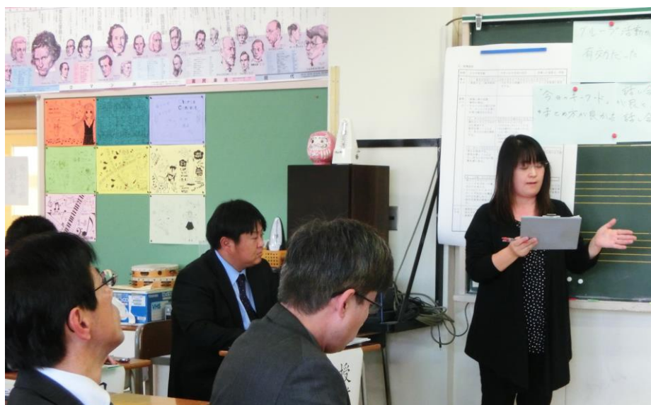
道徳研究授業で学び合い, 高め合う教師集団