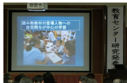
平成 28 年度教育センター研究発表会より