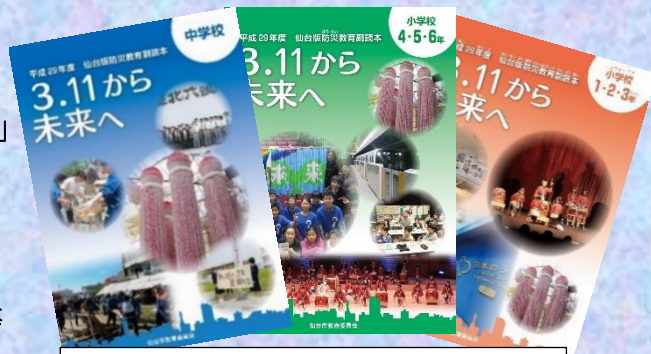
【刊行物「仙台版防災教育副読本」】

センター「要覧」 「センター研修 2017」 「仙台版防災教育副読本 3・11 から未来へ」 「仙台の自然」 「わたしたちのまち仙台」 教育研究紀要 「教育はいま」 教育の情報化研究委員会「活動報告書」 「フレッシュ先生研修ガイドブック」 等