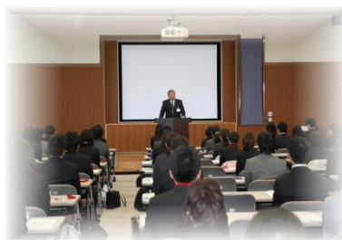
【フレッシュ先生研修】

管理職の世代交代の加速化に伴う、学校経営に携わる人材の育成及び管理職の力量育成を図るため、体系化されたプログラムの下、「2年次校長・2年次教頭対象の研修」「プレ管理職研修」等の新設を含め、研修内容及び回数等について拡充を図ります。