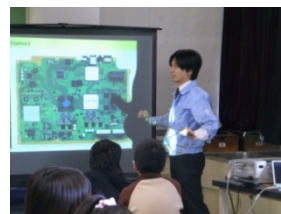
【仙台市理科特別授業】