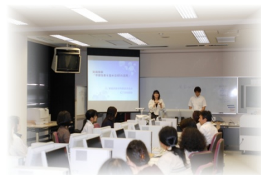
【教育の情報化研究の推進】

職場内における研修並びに同僚間による学び合い、教え合い（＝OJT）により、職務遂行等に必要な力量の育成が図れるよう、プログラムを作成、配信し学校をサポートします。